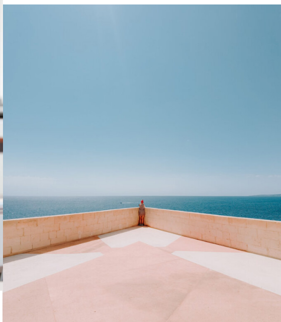
Michał Wesótek. Fotograf