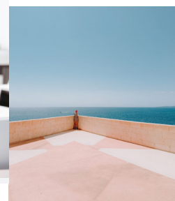
Michał Wesolek. Fotograf